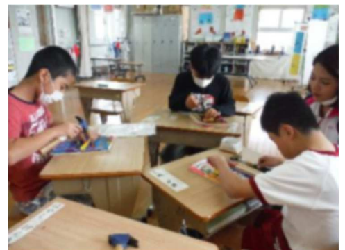
コリントゲーム作り (図画工作)