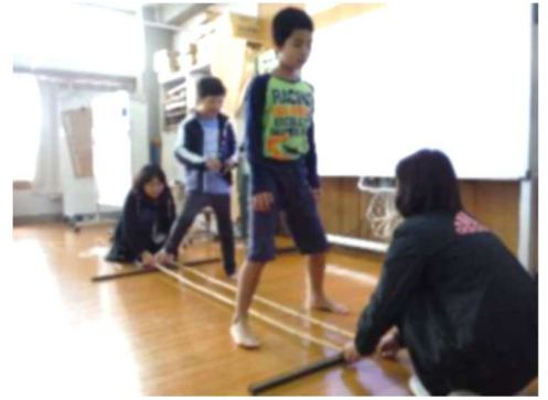
バンブーダンス (分教室音楽)