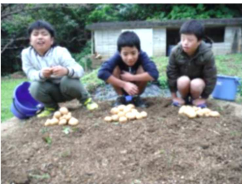
ジャガイモの収穫