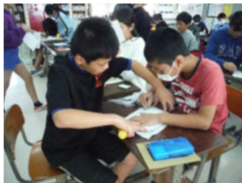
6年生への プレゼント作り(交流)