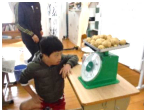
ジャガイモの 重さを量ろう！