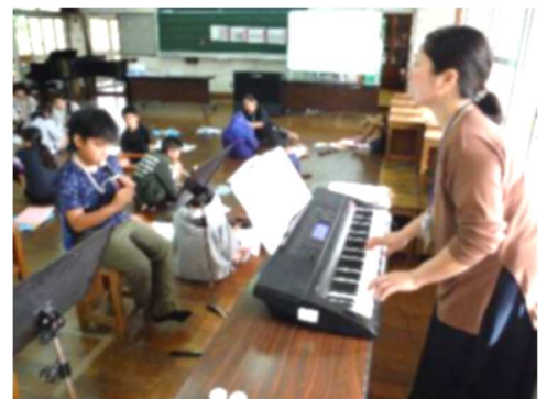
リコーダーのテスト (交流音楽)