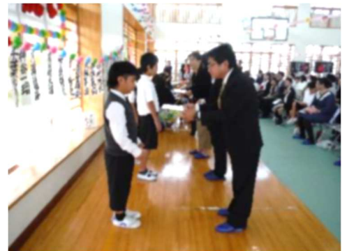
十三祝い(本校交流)