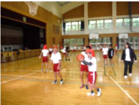
バスケットボール (交流体育)