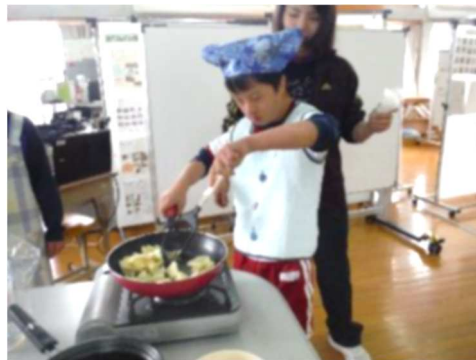
収穫したジャガイモで 調理学習